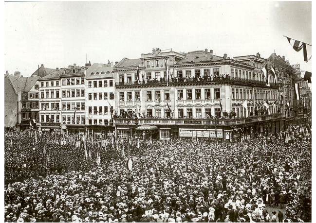
Fotos von Sedanfeiern in Schüttdorf (links) und Frankfurt am Main (rechts) 1895