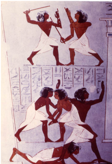
Stockfechten und Ringen im Alten Ägypten