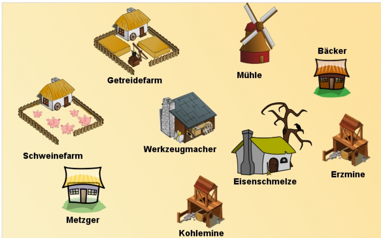
Warenverkehr bei einer Aufbausimulation

Bei einem Aufbausimulationsspiel kann man verschiedene Gebäude bauen. Jedes Gebäude produziert eine bestimmte Ware. Damit das Gebäude arbeiten kann, benötigt es bestimmte Waren: