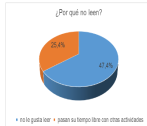
el gráfico circular