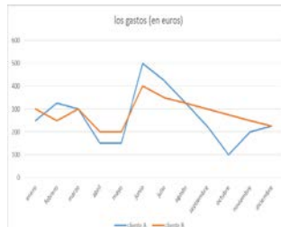
el diagrama de curvas